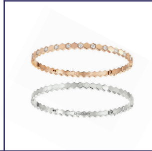
Bee My Love 手镯